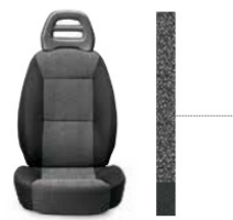
Grijze crêpestof 157