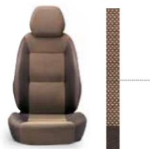
Bruin velours 297