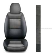
Techno leder 266