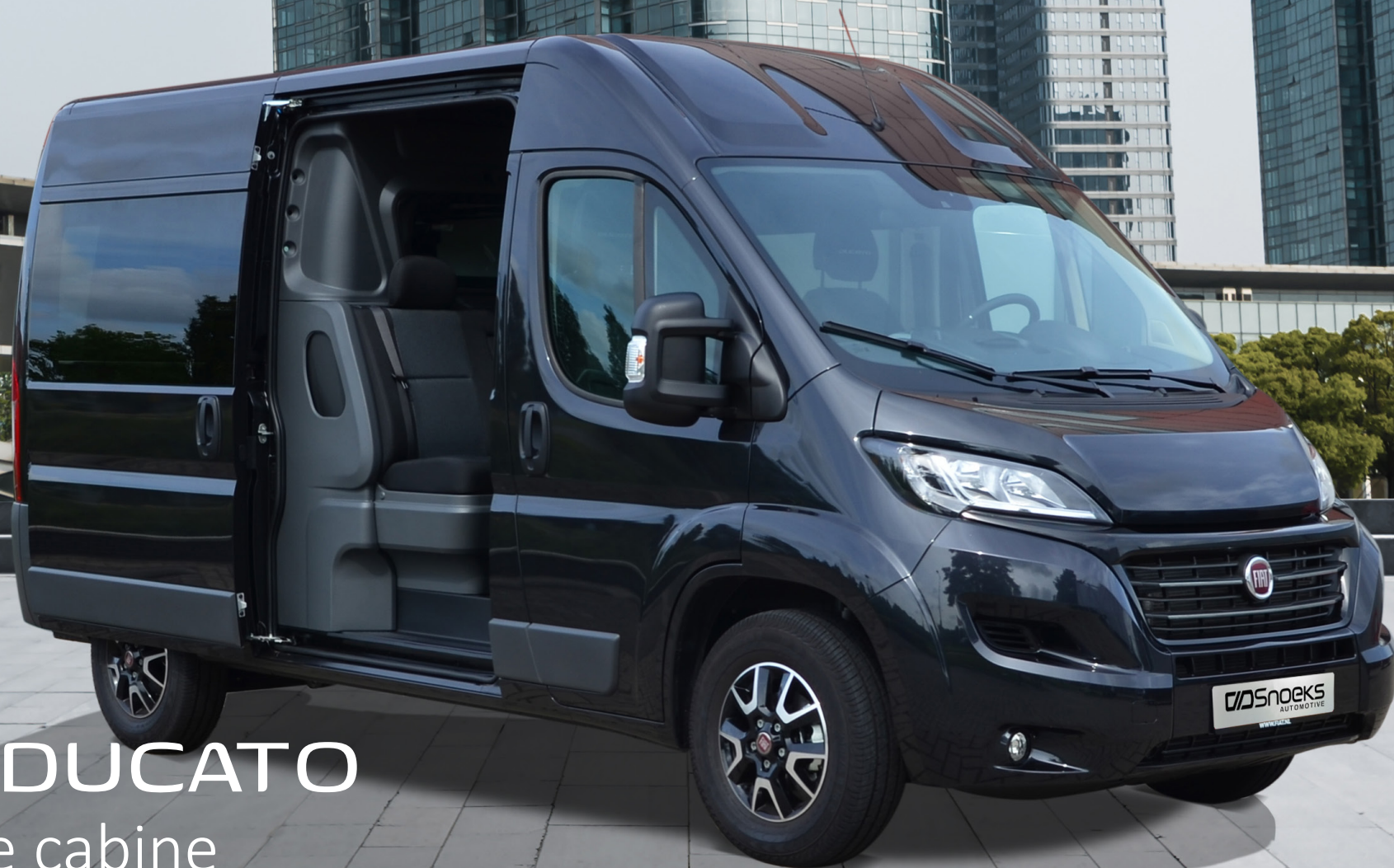
FIAT DUCATO Dubbele cabine