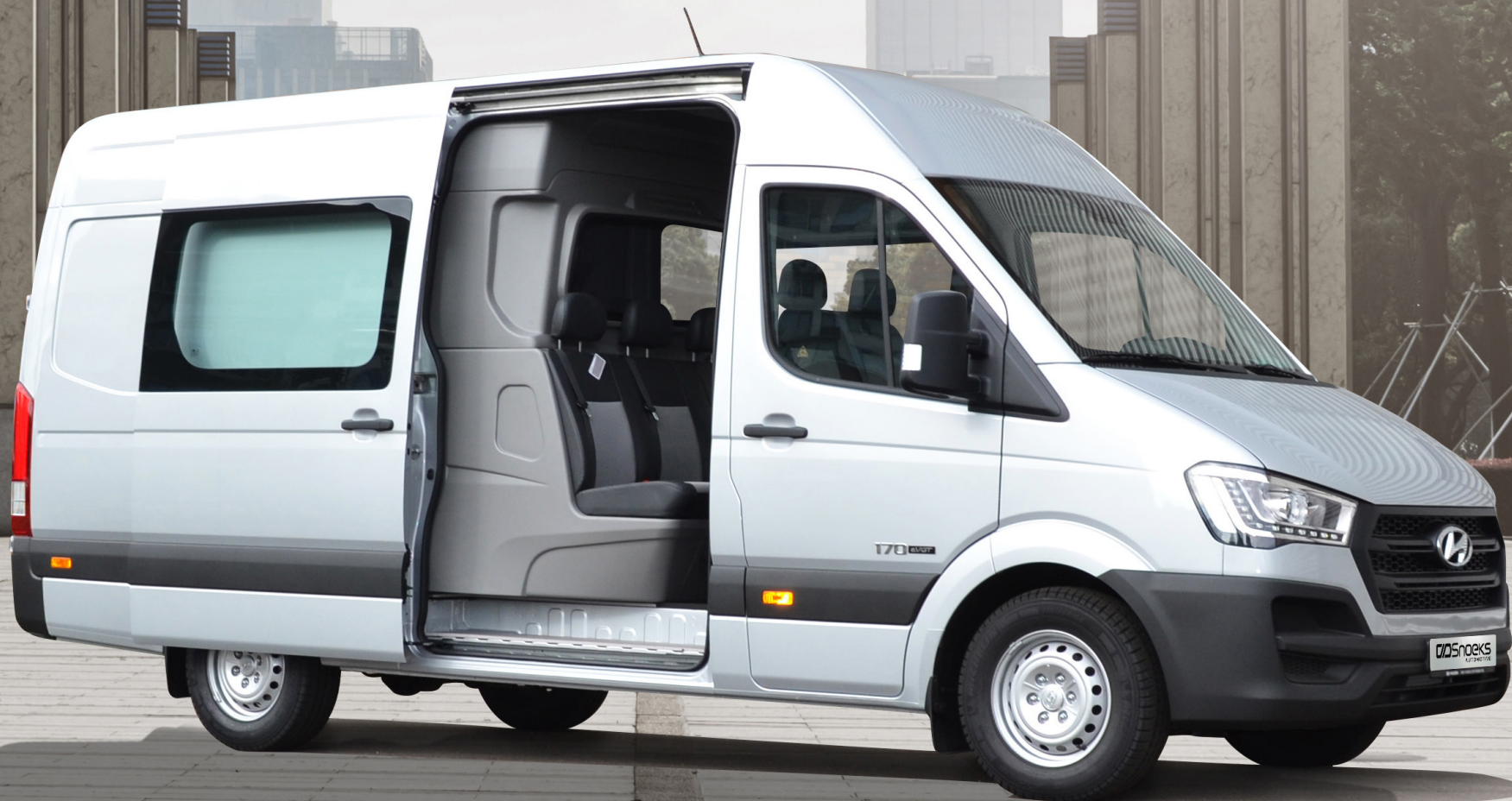
HYUNDAI H350 Dubbele cabine - Prijslijst