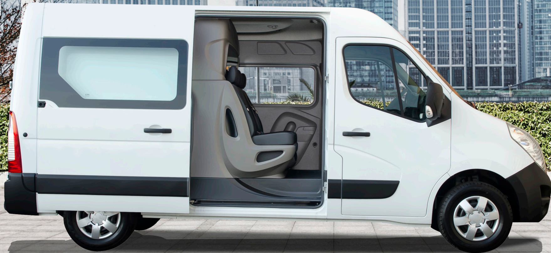
NISSAN INTERSTAR MultiCab