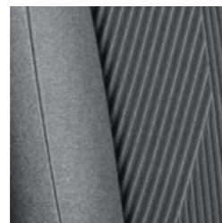
Blau - Dunkelgrau