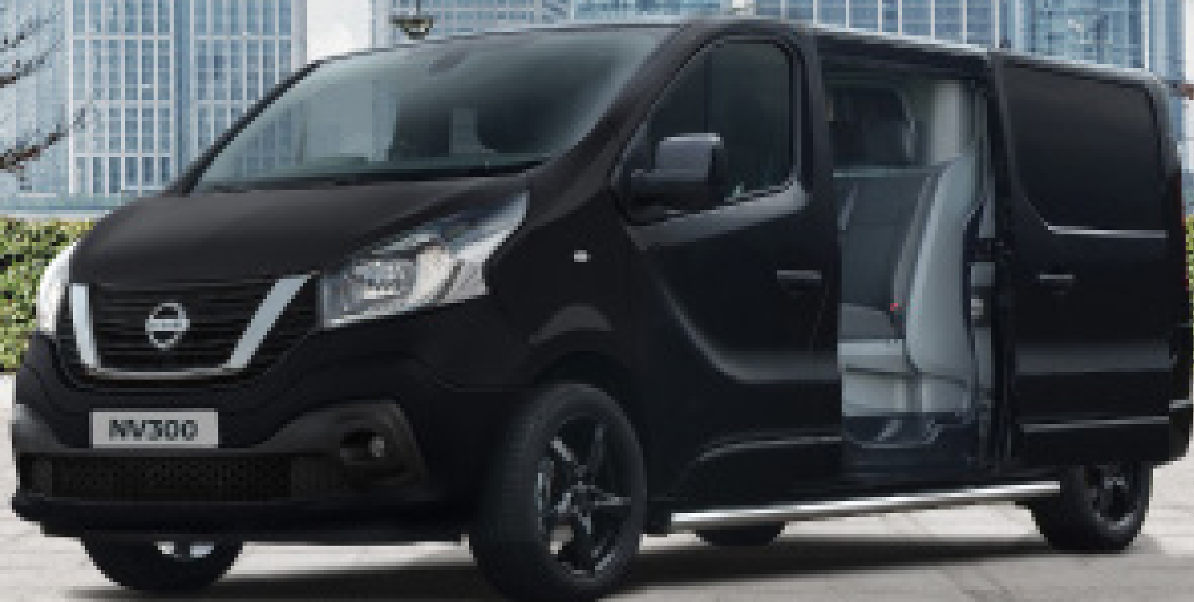
NISSAN NV300 BusinessVan - Preisliste