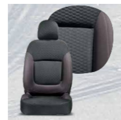
Stoff Braun / Schwarz 098