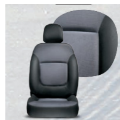
Stoff Schwarz / Dunkelgrau 107