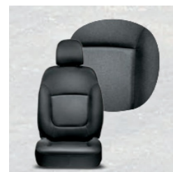
Stoff Schwarz 073